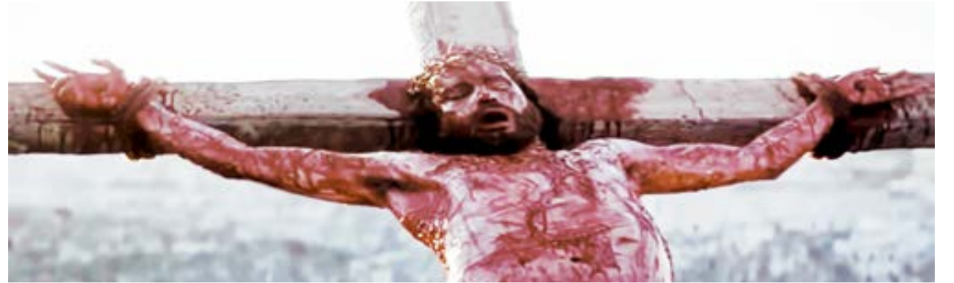
설교하는 박태선 장로의 모습에서 가시면류관을 쓰고 피를 흘리는 예수님의 환상을 보고 통곡하다 영화 '패션 오브 크라이스트 (The Passion Of The Christ, 2004),에서

시온합창단의 공연이 끝나고 밖으로 나갈 때, 일곱째 천사는 이터널 전도사를 만나 반갑게 악수를 했는데 순간 '나는 이긴자이고 너는 죄인이다' 하는 생각이 스쳐가는 것이었습니다. 해와 이긴자께서는 밀실에 들어 오자마자 "조사장, 이 새끼, 자존심 교만 마귀가 들러가지고 비교하는 음란죄에 걸려 떨어졌다."라고 호통을 치며 팔팔 휘시며 웃음을 가하시는 것이었습니다. 그래서 땅바닥에 털썩 주저앉아 목을 놓고 울게 되니 밀실 시구들 모두 대성통곡을 하며 울어서 밀실이 초상집같이 되었습니다.