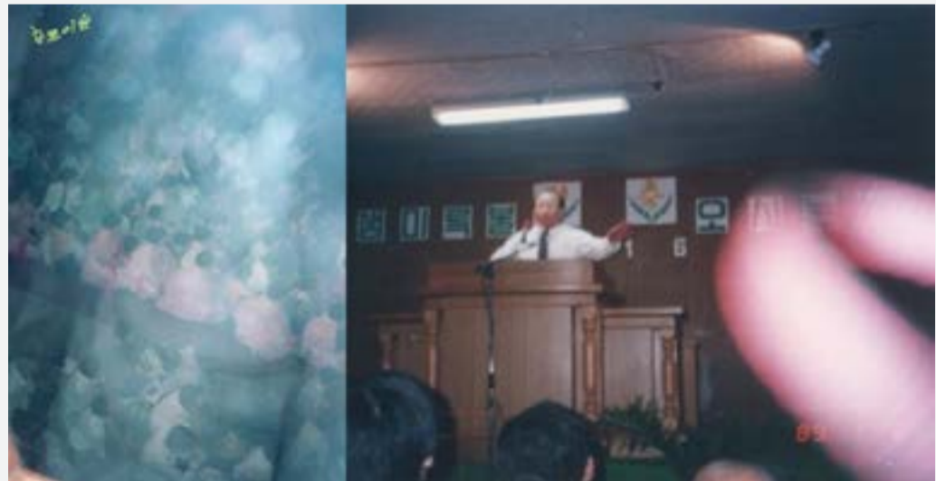
甘露法乳(감로법유): "만일 감로를 먹게 되면 죽을 목숨이 다시 살아나고, 혹 재차 감로를 먹으면 수명이 길어져 장수하리라. 나지도 죽지도 않는다." - 『대반열반경 8권 여래성품 4-5』

[해석] 여기서 말하는 여래는 석존을 말하는 것이 아니고 바로 법신불인 미륵부처님을 가리키는 말씀으로 석존은 자기의 제자인 광명변조고귀덕왕보살마하