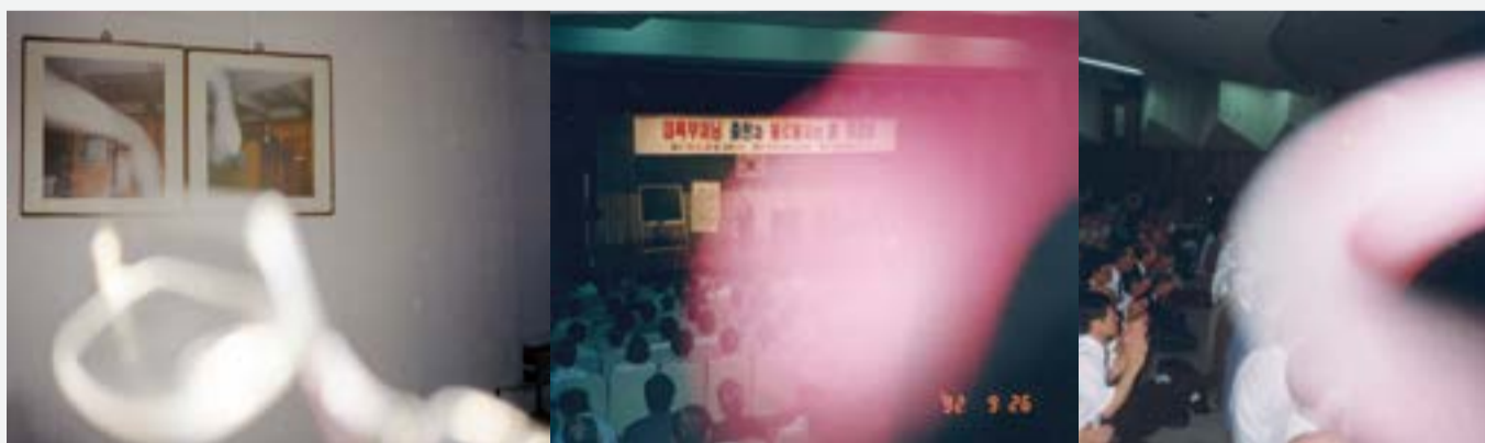
是處無死即是甘露 是甘露者即眞解脫: “김로가 있는 곳에 죽음이 없고 김로를 내리는 분이 진짜 해탈자다.” _ 『大般涅槃經 四相品』

我常宣說一切眾生悉有佛性 乃至一闍維是等亦有佛性 내지일천제등역유불성 내가 항상 일체중생에는 불성이 있다고 말하는 것이며 일천제들도 또한 불성이 있다고 하는 것이다.