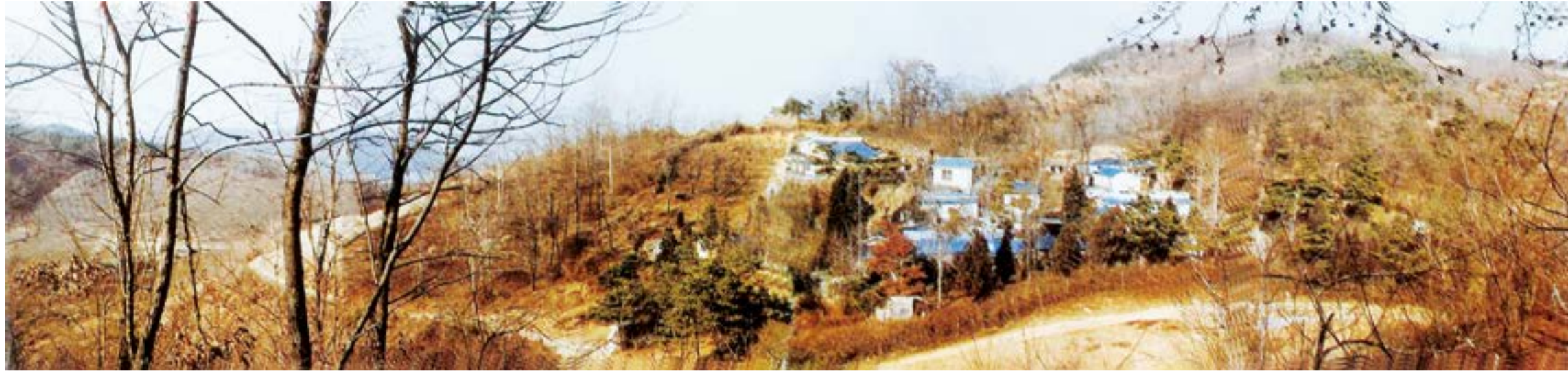
성경과 격암유록에서 증거하는 밀실(구세주 조희성님이 연단 받을 당시의 모습)·내 백성이 갈지이다 네 밀실에 들어가서 네 문을 닫고 분노가 지나기까지 잠깐 숨을지이다(이사야 26:20), 聖住蘇萊老姑地人生造物神主 東海三神亦此山(隱秘歌)