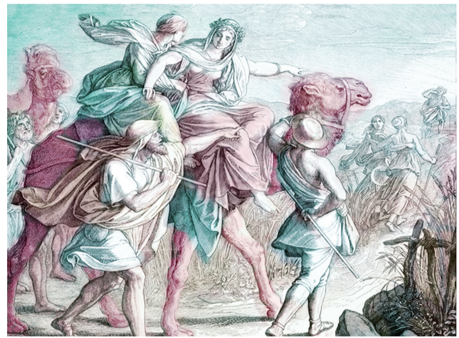
우물가의 저분은 누구십니까?

※ 「대적의 성문,과 원수의 성문」: 6천 년 전에 하나님께서는 에덴동산에서 선악과라는 마귀에게 아담 하나님과 해와 하나님 두 분이 점령당하는 것을 지켜본 장본인이었습니다. 그 당시 마귀가 삼위일체 하나님(하나님과 아담과 해와)과 지혜와 힘이 높았기에, 하나님께서는 속수무책이었습니다. 세 분 하나님 가운데 겨우 마귀를 피해 달아난 나머지 한 분 하나님께서 인류 6천 년 안에 잃어버렸던 아담 하나님과 해와 하나님의 두 씨를 찾아야만 전지전능성을 회복할 수 있으며, 그렇지 못하면 나머지 한 분 하나님마저 마귀에게 멸망당할 수밖에 없는 절체절명의 기로에 서 있게 되었습니다. 아브라함 속에 계셨던 하나님의 신이 외아들 이삭을 번제로 드리는데 순종함으로써, 아브라함의 씨 가운데서 장래에 마귀를 이기는 구세주가 나와서 대적의 성문을 차지할 수 있는 기틀을 마련했습니다(창22:17 「대적의 성문을 차지하라」; 죽음의 문을 부수고 영생하는 천국의 문으로 버림). 한편 하나님께서는 아브라함의 며느리이자 곧 아들 이삭의 아내가 될 리브가를 마귀로부터 공격을 받지 못하는 곳에 예비해 놓으셨습니다. 또 하나님께서 리브가가 마귀의 표적이 되지 않게 하기 위해서 그녀 가족의 입을 빌려, ‘우리 누이여 너는 천만인의 어머니가 될까이다 네 씨로 그 원수의 성문을 열게 할까이다(창24:60)라고 축복하였습니다. 「원수의 성문을 열게 할까이다, 라는 말씀과 「대적의 성문을 차지하라」는 말씀 둘 다 ‘사람이 이길 수 없는 상황(창22:17)은 예언의 내용과 동일하며, 전자의 비유 말씀 두 구절은 후자의 고린도전서 15장 54절의 말씀보다 수천 년을 앞서서 예언한 것임을 알 수 있습니다.