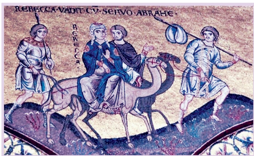
남편 될 이삭을 만나기 위한 리브가의 기나긴 여정

“이 일이 여호와께로 말미암았으니 우리가 어찌 좋다 싫다 하겠습니까! 내 딸 리브가가 당신 앞에 있으니 데리고 가서 여호와 말씀하신 대로 당신 주인의 명대로 삼으시오. 참으로 오늘에 이르러서야 아버지 나흘께서 생전에 ‘형 아브라함에게 진 은혜의 빚을 갚아야 된다’는 염원이 조금이나마 이루어진 것 같습니다. 큰아버지 아브라함께서 이곳 하란을 떠나 가나안 땅으로 가실 때, 데라 할아버지로부터 상속받은 재산 전부를 아버지 나흘에게 주셨다고 합니다. 그리고 큰아버지 아브라함이 하란을 떠난 지 삼 년째 되는 해에 내가 태어났기 때문에 나 브두엘은 큰아버지께서 베푸신 재산의 혜택 속에서 자랐다고 볼 수 있습니다. 돌아가신 모친 밧기도 손녀가 아브라함의 며느리가 된다는 사실에 기뻐하실 것입니다.”